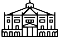
Le Cirque Jules Verne

Pour continuer votre découverte d'Amiens et de son patrimoine historique et culturel voici quelques lieux que vous devriez aller voir :